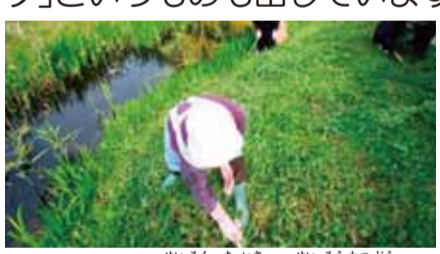
ムサシトミヨ生息地域の清掃活動

また、世界各地でも各地域毎に「この動物は数がかなり減ってきているから大事にしないとイケませんよ!」って教えてくれる「レッドデータブック」というものも出しています。もちろん、埼玉県でもこの「レッドデータブック」を出していて、たくさんの動物や植物が掲載されています。魚だけ見てもかなりの種類が絶滅危惧種として載っているの