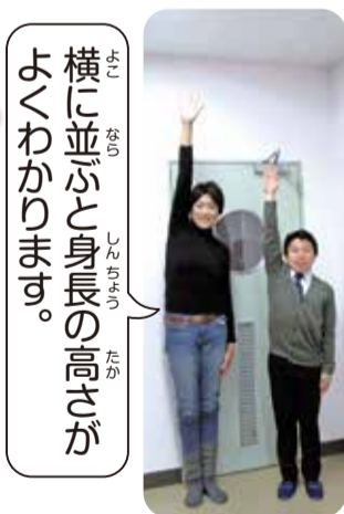
横に並ぶと身長の高さがよくわかります。

調べてみよう 学校にある二九八cmくらいの物は何でしょう? ①とびばこ10段 ②天井 ③下駄箱 答えは熊谷青年会議所のホームページにアクセス!