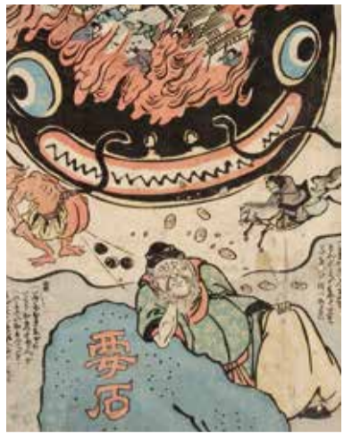
江戸時代に流行した要石と ナマズの絵のお守り

今から400年ほど前 の江戸時代には大ナマ ズと石が書かれた絵が 地震から身を守る『お 守り』として大流行し ました。昔から人は自 然を敬い、大切にし、時 に恐れ、共に生きてきた のです。