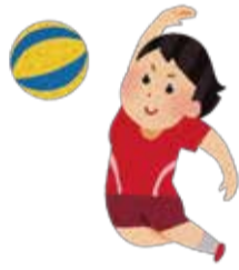
1999年女子バレーの立役者 MIP賞を2回受賞し 実力と共に活躍する姿から『シンデレラガール』と呼ばれました。

ワールドカップで活躍する姿がテレビに取り上げられると、会場入りや出待ちをするファンの方がたくさんできて、そのファンの方たちの応援が力になりました。