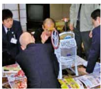
雪くま 開発研究中!! (市役所の方々)