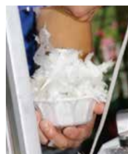
雪のようにするんだよ

雪くまは「世界で一番有名なかき氷」を目指しているんだ。数年後、雪くまを食べに世界中の人が熊谷に来るかもね？