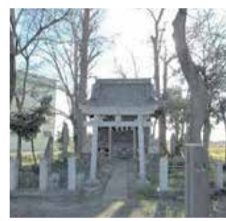
熊谷市三ヶ尻671 田中神社