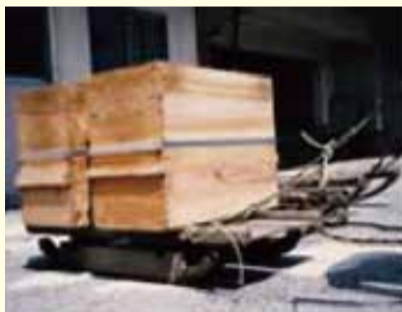
当時を再現した「ソリ」

最初の年にはこんな「ソリ」が 1951年2月に降った大雪の時には、即席で作った「ソリ」を使用して、一度だけ運搬をしました。