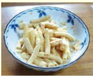
【材料】 マカロニ・きなこ・砂糖 砂糖の代わりに黒糖で試してもとってもおいしいよ!

昔は、人気のあったメニューで「あべかわ」という料理があります。 作り方は超簡単!茹でたマカロニをたっぷりのきなこで砂糖でまぶせば完成! おじいさんやおばあさんに作ってあげると懐かしい昔話が聞けるかもしれませんよ。