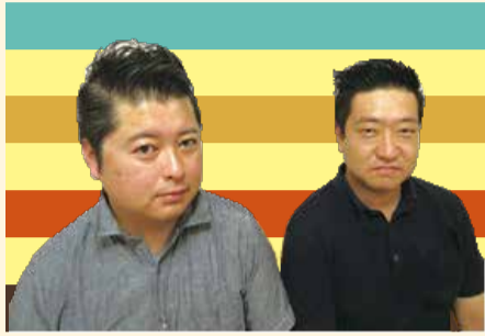
ポマードをつけた青年会議所のおじちゃんたち

左の写真をみてください。ポマードを使って髪型を整えた青年会議所のおじちゃんたちです。ポマードが人気だった1950年代風の髪型を再現してみました。