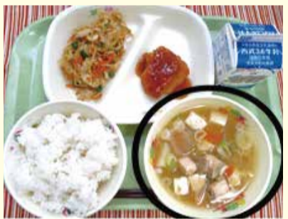
【ふるさと給食】 吟子汁…北海道でとれる鮭とじゃがいもが入ってます。

皆さん「脱脂粉乳」を知っていますか?今ではお菓子の中に入っている位で、直接飲むことは無いと思います。戦後間もない当時、栄養価の高い「脱脂粉乳」の配給が始まりました。 「おかず」はクジラの竜田揚げが人気でしたが、今の給食には登場しませんね。竜田揚げ以外にも、んなおかずがあったかをおじいさんやおばあさんに聞いてみよう。