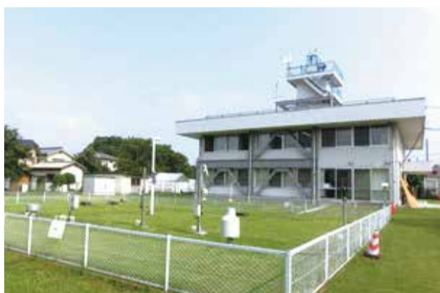
こんな場所で観測しています。

熊谷地方気象台は1896年に設立され、埼玉県の気温の観測や天気予報を発表しています。また、現在の気象台は1957年に熊谷測候所から熊谷地方気象台という名前になりました。