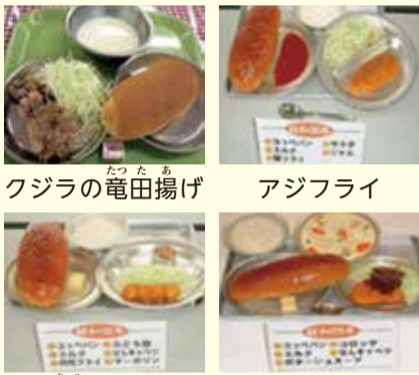
クジラの竜田揚げ アジフライ 月見フライ コロッケ 【1950年代、当時のおかず】

1950年代は戦後でまだ食べ物が少ない、お弁当を学校に持ってこれる子どもは少なかったのです。そのため、学校で給食を出して欲しいとの声が多く、学校給食が始まりました。