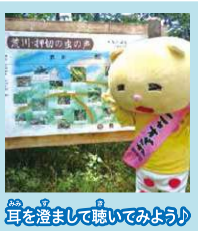
目を澄まして聴いてみよう♪

日本の音風景100選は、平成8年、国の環境庁（現在の環境省）が、将来もずっと残していきたい音の聞こえる環境を「音風景」として日本全国から募集したんだ。たくさんある中からこの「荒川・押切の虫の声」も選ばれたんだって！全国にある「音風景100選」の中で、「秋に鳴く虫の声」が選ばれたのは4箇所しかありません。つまり、日本・四大虫のうちのひとつがこの「荒川・押切の虫の声」なんだ。