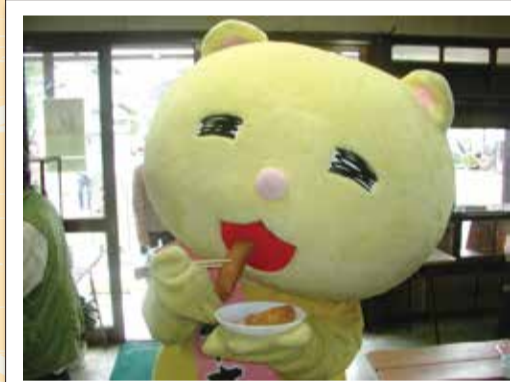
ニャオざねもいなり寿司が大好き

妻沼の「聖天寿司」では、縁結びにちなんでかんばんようでいなり寿司を結んだ「縁結びメニュー」が人気ですよ。