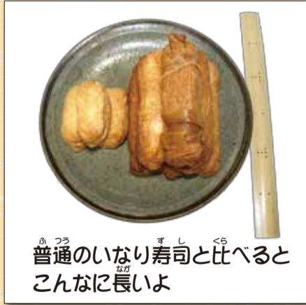
普通のいなり寿司と比べるとこんなに長いよ

熊谷市の北部、国宝「聖天様」で有名な妻沼には日本でも珍しい「いなり寿司」があります。長さ約13cmの大きさは、一般的な物と比べると違いは一目瞭然です。何故このような長い形になったのでしょうか？ニャオざねと一緒にひみつを探ってみましょう！