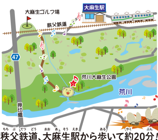
秩父鉄道、大麻生駅から歩いて約20分!

熊谷にはこのように自然がたくさん残されているんだ。みんなも、もつと自然に触れて色々な事を体験しよう！