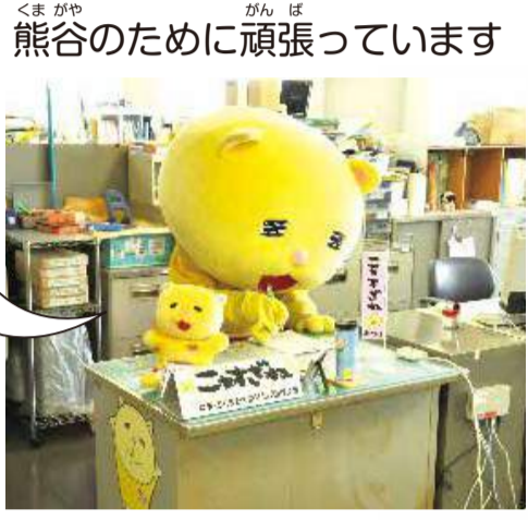
熊谷のために頑張っています