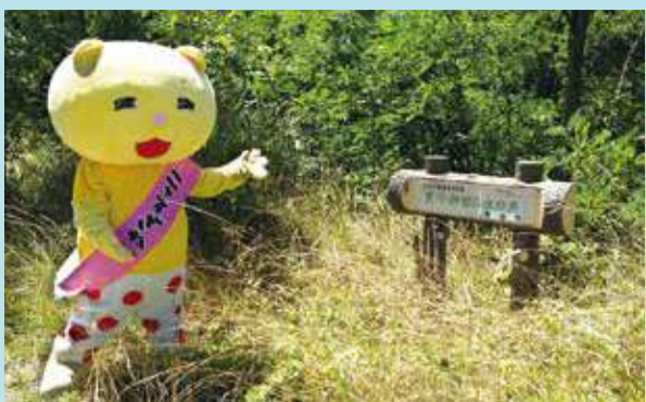
ここは一体なんだろう??