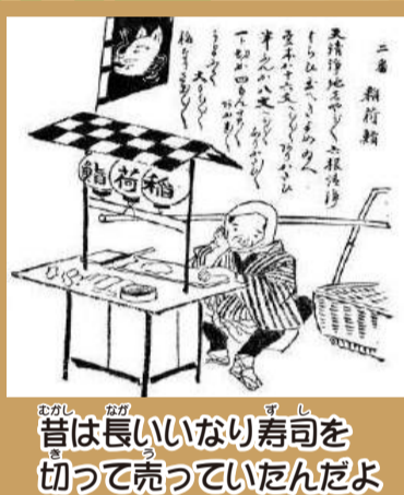
昔は長いいなり寿司を切って売っていたんだよ

ます。どうやら、長いいなり寿司をお客さんの好みの長さで切り売りをしてきたようなのです。ですから、妻沼のいなり寿司は長くなったのではなく、江戸時代のもともとの長さを今日まで残し続けていたのです。