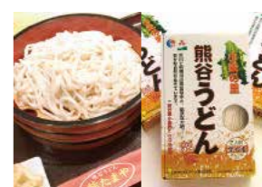
会場/タカヒロフーズ株式会社 講師/田野隆広 定員/10名 持ち物/エプロン 材料費/500円

熊谷うどん 熊たまや 熊谷市大原1-2-47 ☎048-521-8477 ☎048-521-8417 9:00～17:00 定休日/火曜 http://takahirofoods.ecnet.jp/