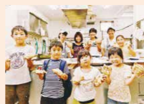
会場/さわた 妻沼店 定員/5名 材料費/500円 対象/小学生

さわた 妻沼店 熊谷市妻沼1416 ☎048-588-0105 7:00～17:00 定休日/火曜