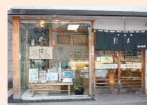
会場/堀内製菓 講師/堀内伸治 定員/2名より 持ち物/エプロン 材料費/1人3,600円 対象/小学生以上

堀内製菓 熊谷市本町2-15 ☎048-522-1556 ☎048-522-6913 9:00～18:00 定休日/日曜