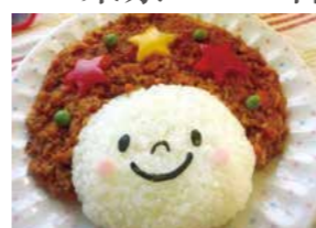
会場/東京ガス(株)熊谷支社1F「ガスポットくまがや」 講師/東京ガス料理教室スタッフ 定員/1教室8～12人 持ち物/エプロン・ハンドタオル・筆記用具 材料費/3,000円～ 対象/一般、親子など

東京ガス(株)熊谷支社 熊谷市銀座3-71 ☎048-522-1025 ☎048-522-1049 9:00～17:00 定休日/土曜・日曜・祝祭日