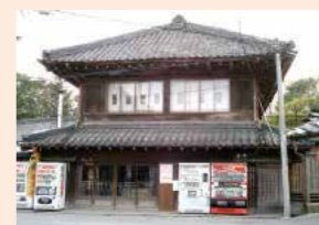
会場/権田酒造 株式会社 講師/権田清志 定員/6名以上で実施 材料費/5,000円 対象/成人

権田酒造 株式会社 熊谷市三ヶ尻1491 ☎048-532-3611 ☎048-532-7889 9:00～18:30 定休日/日曜・祝日、年始 http://www.gondaysuzou.com