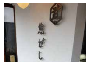
会場/焦がし屋 武一 講師/小林伸光 定員/3～5名 持ち物/無し 材料費/3,000円

焦がし屋 武一 熊谷市妻沼1536 ☎048-580-3525 10:00～18:00 定休日/月曜 ハープ・ほうじ茶専門店自家焙煎ほうじ茶を作っています。