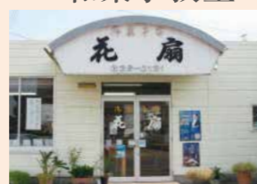
会場/花扇店内 講師/高橋 隆・功典 定員/15名 持ち物/手巾巾、筆記用具、エプロン等 材料費/1,000円 対象/小学生から

御菓子司 花扇 熊谷市中西3-15-15 ☎048-526-0121 10:00～18:00 定休日/月曜