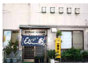
会場/いづみ寿司 講師/大澤義則、大澤重明 定員/10名 持ち物/エプロン 材料費/500円

いづみ寿司 熊谷市本町1-206 ☎048-521-2640 11:30～13:30、17:00～23:00 定休日/日曜